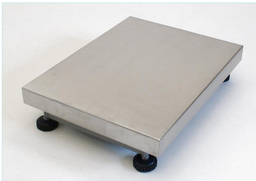
Bilden visar Modell B storlek 450 x 600

Modell A/B är en robust industrivåg för vägningsoråde 0 – 5kg, 0 – 15kg, 0 – 30kg, 0 – 60kg, 0 – 150kg eller 0 – 300kg. Vågen har utvecklats speciellt för att tåla tuff industri-miljö med inbyggda överlastskydd och transportsäkringar. Driftsäkerheten är därför också mycket hög. Lastcellen är typgodkänd enligt klass C3.