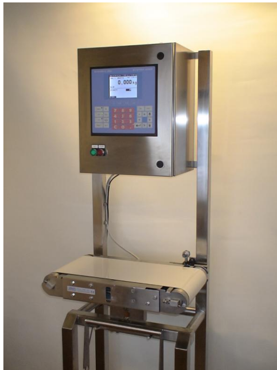
Exempel på applikation

Dyn 5000 är ett flexibelt system för vägning under rörelse. Dyn 5000 består främst av våginstrumentet SWI 5500 som är ett skalbart system där antal vågkanaler och kommunikationsportar expanderas efter behov. Produkten som ska vägas rör sig över en våg som dynamiskt läser av vikten. Ofta byggs dynamisk vägning in i transportbanor där det inte finns tid att stanna för statisk vägning. Därefter kan vikten användas till en rad olika tillämpningar som t ex loggning till dator/skrivare, toleranskontroll med bortsortering och etikettapplicering.